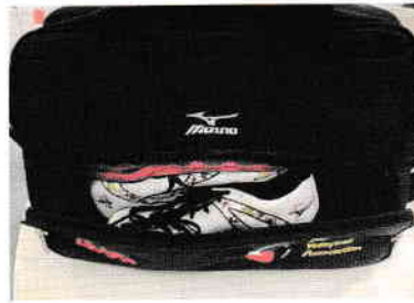
正面にシューズ収納可能ポケットあり